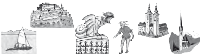
Abb. 1: Kärntner Wahrzeichen